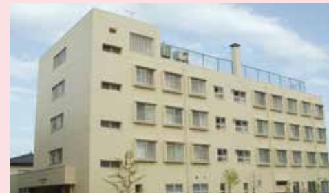
◀女子学生寮「誠心寮」